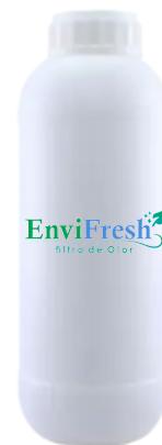
AROMATIZANTE PARA FILTRO