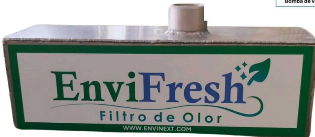
FILTRO DE OLOR PARA CISTERNA DE 1M3 A 10M3